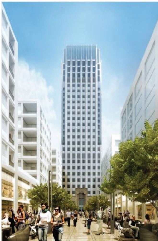
Nowy Szkieletor, czyli Treimorfa, to wspólny projekt GD&K Group i Verity Development