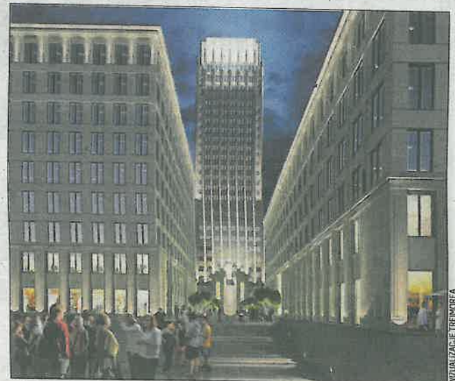
A tak w nocy