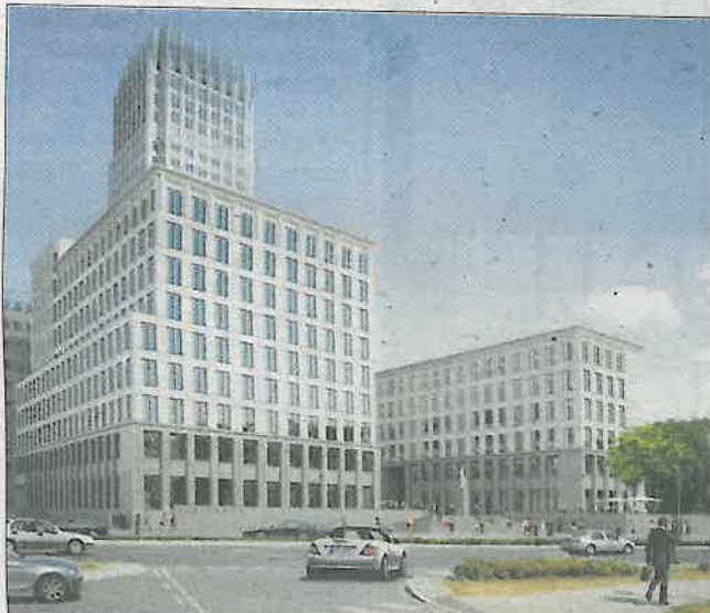
Tak będzie wyglądał kompleks Treimorfa od strony ul. Lubomirskiego